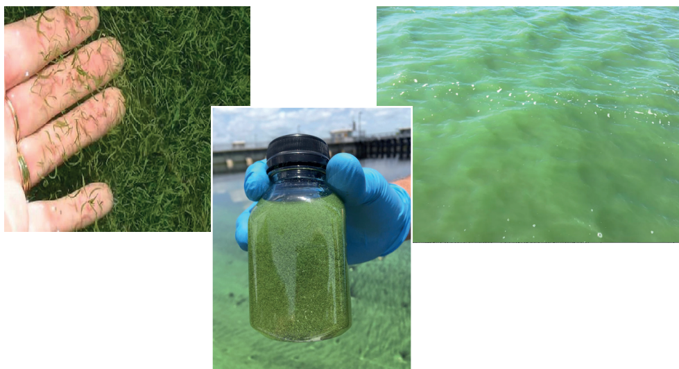
FIGUUR 2. VOORBEELDEN VAN DICHTHEDEN BLAUWALGEN IN OPPERVLAKTEWATER, MET "GRASPLUKJES" (LINKS), MACROSCOPISCH GROTE KOLONIES (MIDDEN) OF EGAAL GROEN WATER (RECHTS).

Voordat water ingelaten wordt, kan een quickscan van het in te laten water een indicatie geven van de aanwezigheid van blauwalgen. Dat kan in eerste instantie op basis van een visuele waarneming, waarbij men een watermonster neemt en ter plekke beoordeelt of er 1) 'groene bolletjes' of 2) 'grassprietjes' voorkomen, of dat 3) de kleur van het water egaal groen is (figuur 2). Eventuele aanwezigheid van drijflagen kan gescoord worden volgens de aanwijzingen in het Blauwalgenprotocol zwemwater (versie 2020). Is één van de bovenstaande situaties aan de orde, dan gaat men over tot het nemen van een watermonster, ten behoeve van het meten van cyanochlorofyl en/of het tellen van blauwalgen cellen en het bepalen van het biovolume. Indien het in te laten water geen indicatie geeft van aanwezigheid van blauwalg dan kan het water zonder risico voor de bij Stap 1 genoemde functies ingelaten worden.